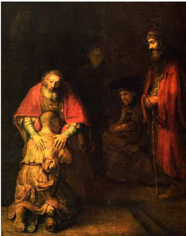
Rembrandt van Rijn